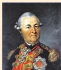
Kurfürst Karl Theodor 1724 – 1799.