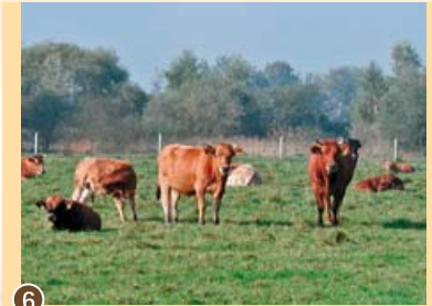
6 Rinder auf der Weide, 2005.